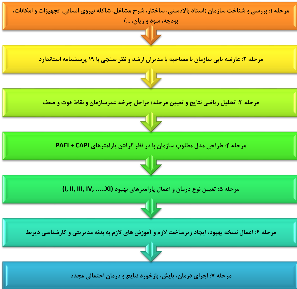
شکل ۳- مراحل عارضه یابی سازمان بر اساس مدل تحلیل دوره عمر